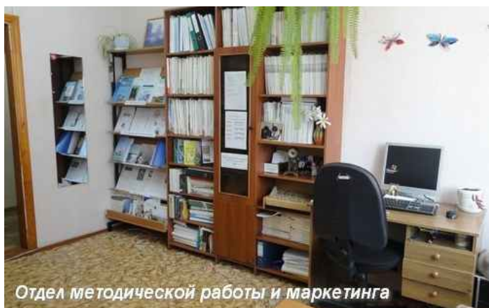
Отдел методической работы и маркетинга