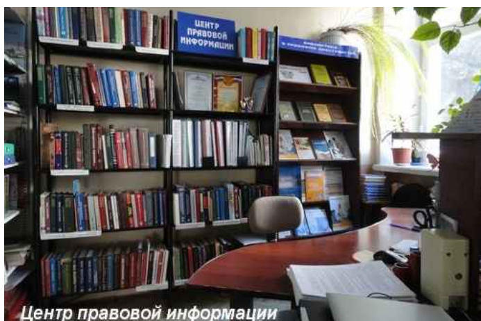
Центр правовой информации