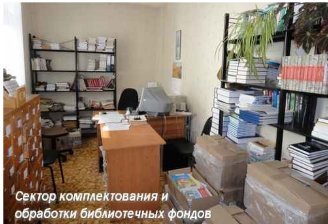
Сектор комплектования и обработки библиотечных фондов